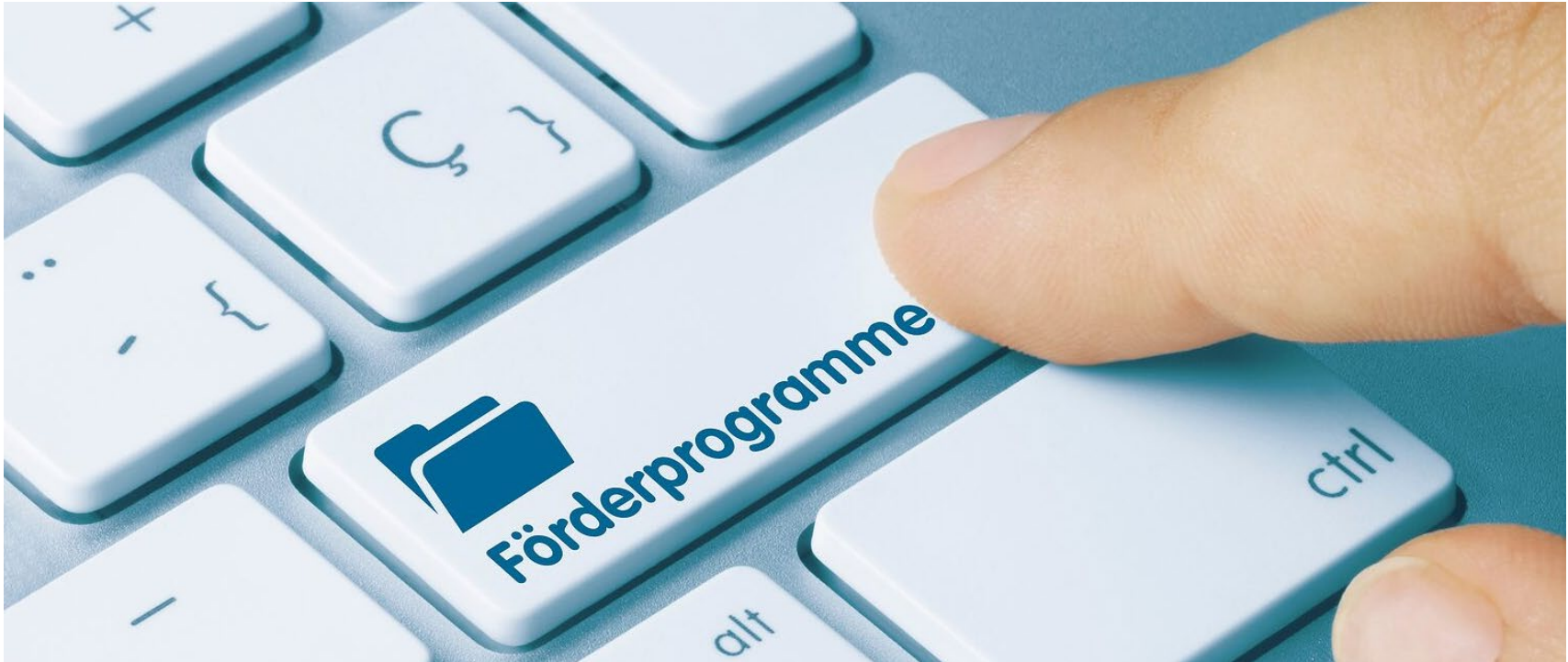
Tabelle mögliche Förderprogramme zum Thema Digitalisierung und Unternehmensentwicklung “Förderprogramme-KH-Online“

https://www.kh-online.de/wp-content/uploads/2023-01-10-Digitalisierung-und-alle-Foerderprogramme-Bund-und-Land-NRW_HRE.pdf